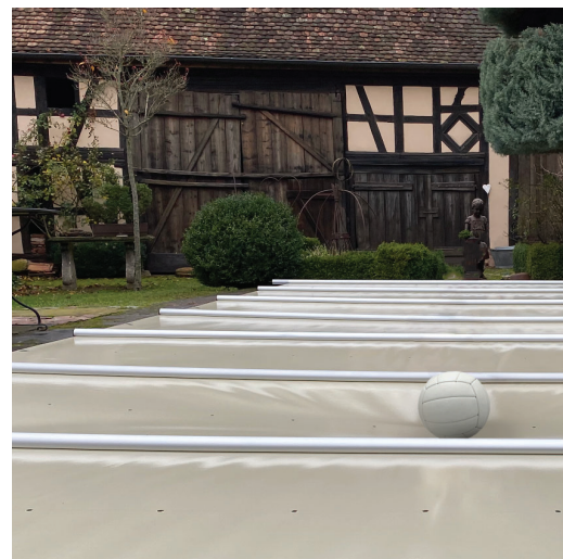
Sicherheit für Kinder und Haustiere