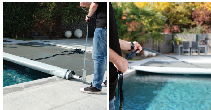
Aufrollen mit Handkurbel